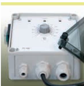
Elektronischer Temperaturregler HM-EC210

Zur Temperaturregelung empfehlen wir unser Programm an elektronischen Steuer- und Temperaturregelgeräten sowie die entsprechenden Temperaturfühler: