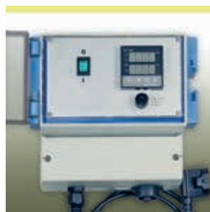
Elektronischer Temperaturregler Serie HM-RD1000