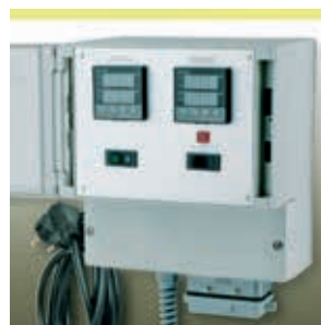
Regler- und Begrenzer- kombination HM-RD3000