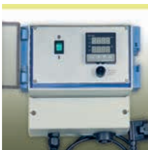
Einhand-Regler Serie HM-RD1000

Wir liefern ein auf unsere Heizschläuche abgestimmtes Programm an Steuer- und Regelgeräten