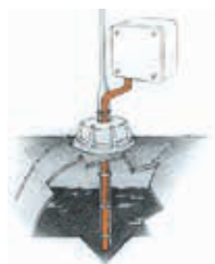
Frostschutz von Ölleitungen