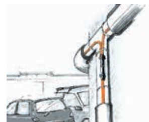
Frostschutz von exponierten Rohrleitungen