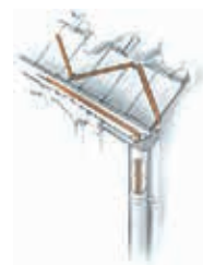
Beheizungen von Dachrinnen und Fallrohren