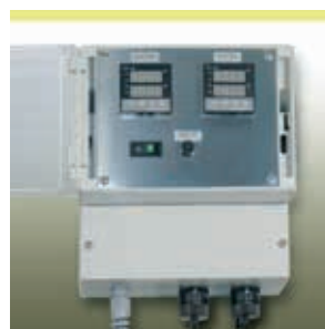
Elektronischer Doppelregler Serie HM-RD2000