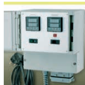
Regler- und Begrenzerkombination HM-RD3000