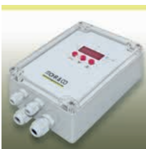
Elektronischer Temperaturregler HM-DTR

Zur Temperaturregelung empfehlen wir unser Programm an elektronischen Steuer- und Temperaturregelgeräten sowie die entsprechenden Temperaturfühler.