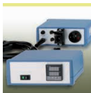
Elektronischer Laborregler Serie HM-RX1000