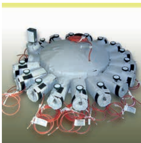
Beheizung für Kalibriersystem